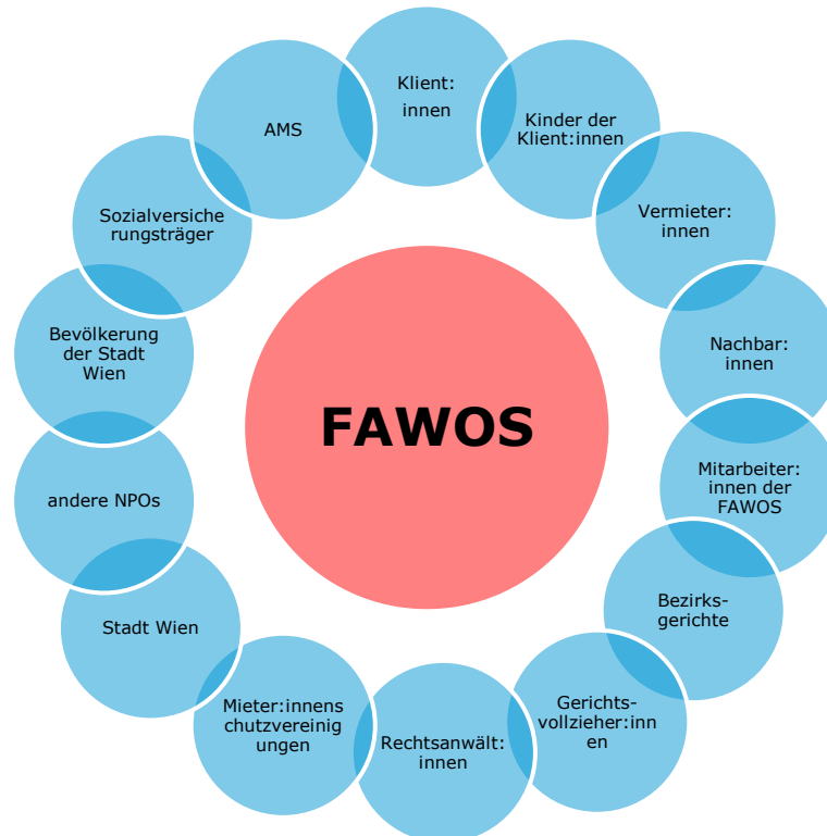
ABBILDUNG 1: WESENTLICHE STAKEHOLDER UND WIRKUNGSBETROFFENE FÜR DIE ANALYSE

Insgesamt gab es im Beobachtungszeitraum Investitionen in Höhe von 929.881 Euro . Fördergeber der FAWOS ist die Stadt Wien (Magistratsabteilung 40), die somit finanziell hinter der Wirkung steht. Dem Input von knapp 1 Mio. Euro stehen um ein Vielfaches höhere monetarisierte Wirkungen in Höhe von rund 87,4 Mio. Euro gegenüber. Durch die Gegenüberstellung der Investitionen mit der Summe der monetarisierten Wirkungen, ergibt sich ein SROI-Wert von 94,02 . Das bedeutet, dass jeder investierte Euro Wirkungen im monetarisierten Gegenwert von 94,02 Euro schafft . Der resultierende SROI-Wert ist vergleichsweise extrem hoch, was darauf zurückzuführen ist, dass die Vermeidung einer Delogierung beziehungsweise die Sicherung des Wohnraums eine Reihe weiterer Negativwirkungen vorbeugt und dadurch stark präventiv wirkt. Die Studie zeigt somit, dass Wohnen als menschliches Grundbedürfnis wesentlich ist und dessen Nichterfüllung weitreichende Folgen haben kann.